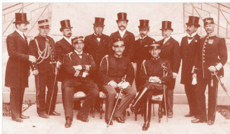
Стоять: члени Першого Міжнародного Олімпійського Комітету, третій праворуч О.Д.Бутовський. Сидять: крон-принц Костянтин – президент Оргкомітету Ігор І Олімпіади з принцями Ніколасом та Георгом