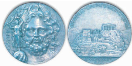
Срібна медаль (лицьовий та зворотний бік), якою нагороджувались чемпіони Олімпіади. На лицьовій стороні Зевс тримає в руці статулю Ніки, богині перемоги, на зворотній – Акрополь