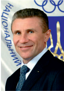
Сергій Назарович Бубка