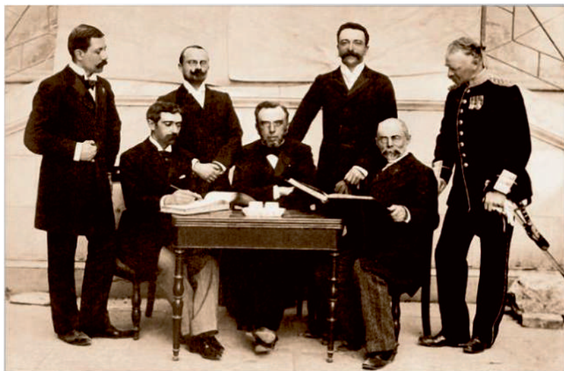
Група членів МОК (Афіни, 1896 рік). Ліворуч: сидять – П'єр де Кубертен (Франція), президент МОК Деметріус Вікелас (Греція), генерал Олексій Бутовський (Росія); стоять – Вільгельм Гебгардт (Німеччина), Іржі Гут-Ярковські (Богемія), Ференц Кемень (Угорщина), генерал Віктор Балк (Швеція)