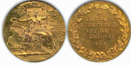
Пам'ятна позолочена бронзова медаль (лицьовий та зворотний бік), якою нагороджувались особи, що сприяли організації та проведенню Олімпіади