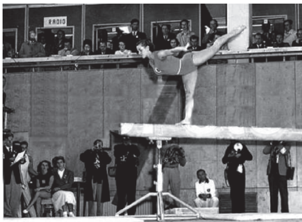
Гельсінкі, 1952 р. Виступ на золоту медаль