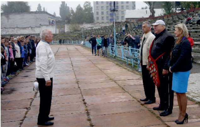
Відкриття легкоатлетичного турніру на призи В.В. Кисельова, м. Кременчук