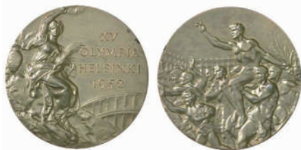
Перша українська золота медаль Ніни Бочарової