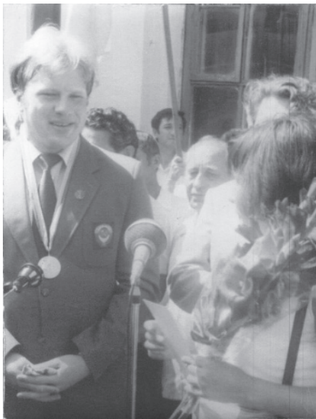
Зустріч олімпійського чемпіона на вокзалі у Полтаві