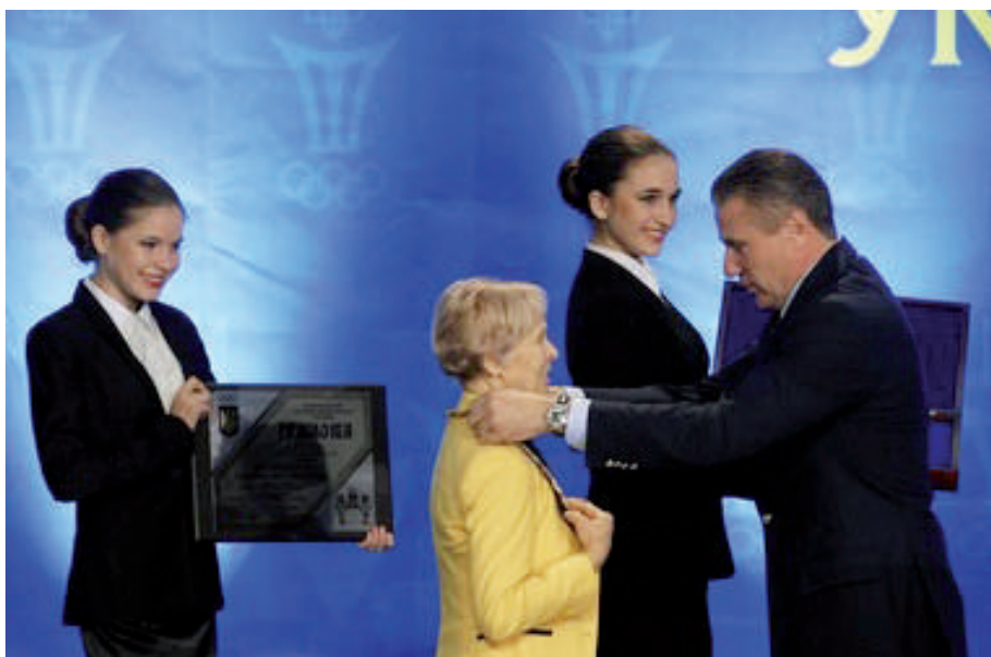
Сергій Бубка нагороджує Ніну Бочарову «Олімпійським орденом»